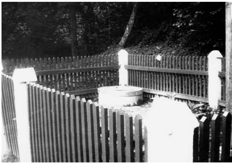
Seredžiaus šv. Jono šulinėlis. 1995 m.