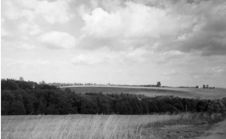
Besmerčių šaltinio santaka su Lašiša (vaizdas iš pietvakarių). 1997 m.