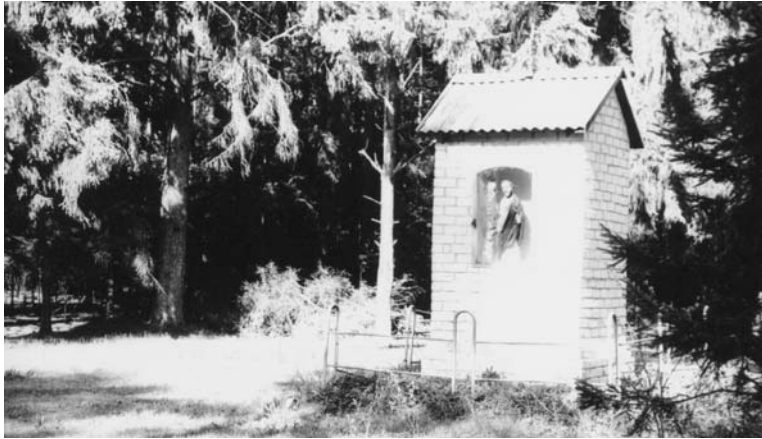
Palazduonis. Mūrinė koplytėlė aukščiau šaltinio. 1997 m.