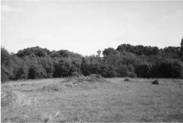
Palazduonio kalnelis prie dvarvietės.