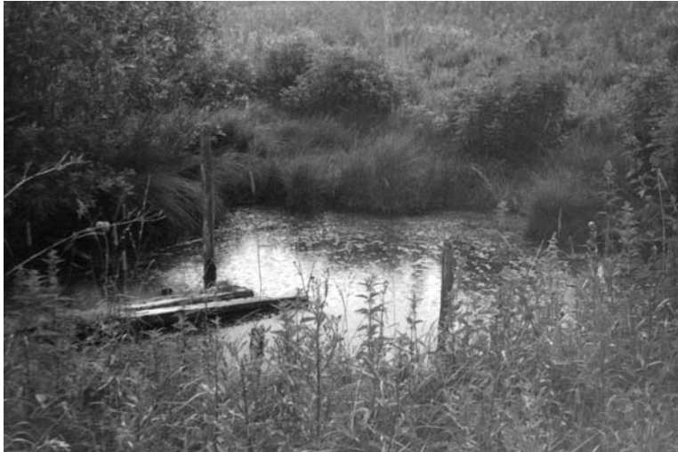
Pašilių Alkaus šaltinis. 1996 m.