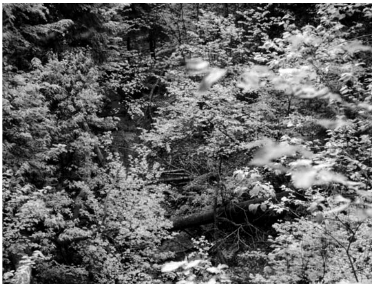
Ringovės Šventupis. 1998 m.

9. Seredžiaus šv. Jono šulinėlis yra šiaurės vakarinėje miestelio dalyje, 0,36 km į šiaurės rytus nuo piliakalnio, 0,3 km į šiaurės vakarus nuo bažnyčios, Pieštės upelio dešiniajame krante, apie 0,02 km į rytus nuo Pieštės ir Šv. Jono upelių santakos. Atrodo, kad praeityje šaltinio vanduo trumpu grioveliu nutekėdavo į pietryčius, į Pieštę. Dabar virš šaltinio įrengtas šulinys, šalia stovi koplytstulpis su šv. Jono Krikštytojo skulptūra*.