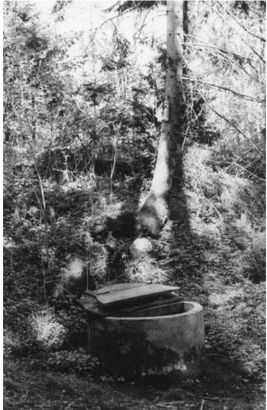
Palazduonio šaltinis. 1997 m.

Jinai akla buvo, ją kažkas tai nuvedė te į tą šaltinėlį. Jinai nusiprausė ir praregėjo. Kaip jinai praregėjo, tai jie <...> nuvežė tą vandenį, ištyrė, ka jis yra šventas, ir, vienu žodžiu, gydomas. Nu i va, i nuo to i buvo te padaryta „pinigus mesk“ – skarbonka tokia, stiklinė, ta koplyčia tokia padaryta, tokia stikliniais langais. Vienu žodžiu, te įdėta viskas. Tai dabar, i buvo padaryta, metė aukas, te rinkdavo, paskui atidarydavo tas aukas. [Na, ir] išsirado koks vagilis, imdavo. Kai tik įmeta, [ir] padaryta toks, lyg kunigas. Kaip tik įkrenta ten tų pinigų, statula i linktelieja galva, o. Paskui jau vagilis pradėjo vogt iš te <...>.