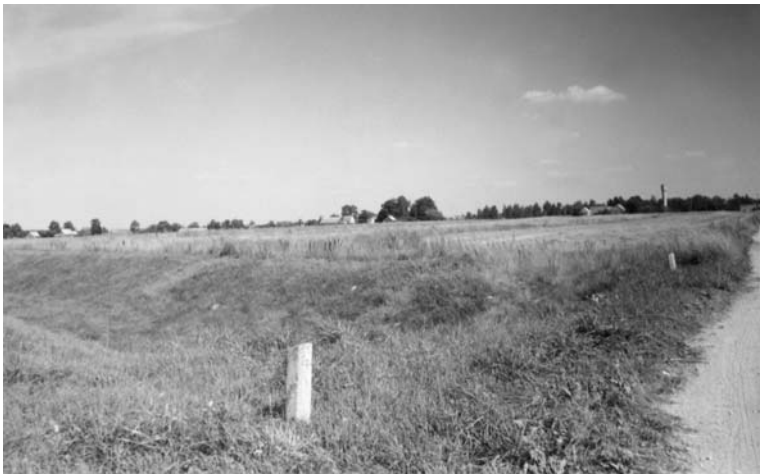
Mikliūnų Šventupio pralaida kelyje numelioruotose Bataliono pievose. 1997 m.