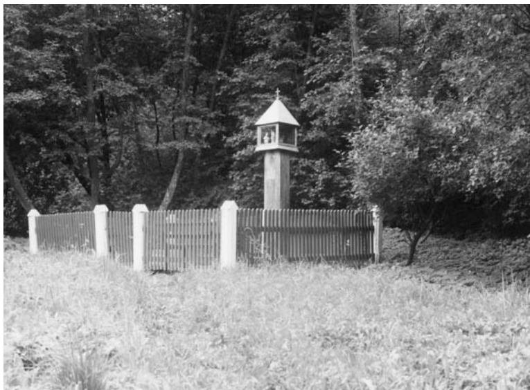
Seredžius. Koplytstulpis prie Šv. Jono šulinėlio. 1995 m.