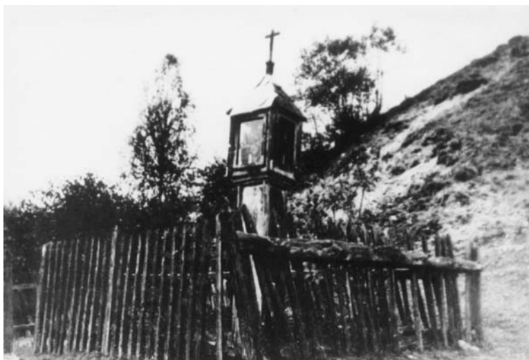
Šv. Jono koplytėlė. Skulpt. J. Zokas. 1931 m.