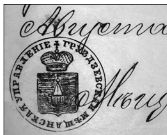
XIX a. Gruzdžių miestelio valdybos antspaudas