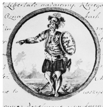
Šakynos miesto herbas. 1792 m. Lietuvos Metrika

Taigi 1792 m. įkurta Šakynos savivalda veikė labai trumpai ir buvo panaikinta tų pačių metų viduryje, netrukus po privilegijos išdavimo. Nėra jokių duomenų, kad ji vėliau būtų buvusi atgaivinta. Šaltiniuose minimi tik į valdinius sugrįžę miestelėnai. Kardinaliai pakito ir politinė situacija. 1793 m. pradžioje Peterburge Rusija ir Prūsija pasirašė sutartį dėl antrojo valstybės padalijimo. Nuo tuometinės Lietuvos buvo atplėšta visa Minsko, rytinė Vilniaus vaivadijos dalis su Breslauja, buvusios Polocko vaivadijos likučiai bei kai kurios Bresto ir Naugarduko vaivadijų sritys su Pinsku, Nesvyžiumi, Slucku. Pagaliau 1795 m., kai Peterburge Rusija ir Austrija pasirašė sutartį dėl trečiojo valstybės padalijimo, beveik visos Lietuvai priklausiusios žemės atiteko Rusijai, o Užnemunė, kurioje nuo 1794 m. šeiminkavo prūsų kariuomenė, Prūsijai 17 . Lietuvos Didžiosios Kunigaikštystės žemės ilgiau nei šimtmečiui pateko Rusijos imperijos sudėtin. Prieš keletą metų Šakynos įgytas herbas taip pat nuėjo į užmarštį.