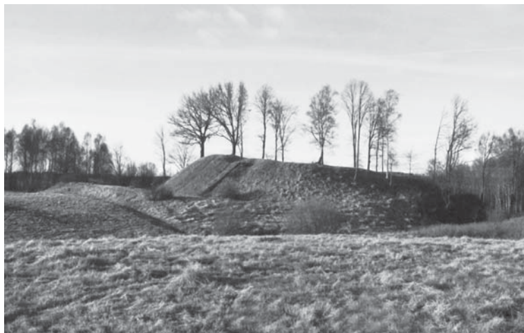
Treigių piliakalnis. 2003 m.

dar kartą nužygiavo į Medininkų valsčių ir ten puolė „pilį, vardu Sizditė“ 9 , jos „pilėnai smarkiai priešinosi“. Šioje ilgokai užtrukusioje kovoje „lietuviai neteko Masiaus brolio bei 18 kitų [vyrų], kurie krito nukauti“. Ordinas neteko trijų savo brolių bei kitų karių. „Ne kažką laimėję puldami pilį“ Ordino kariai dar kartą nusiaubė pilies apylinkes „degindami ir plėšdami“ 10 .