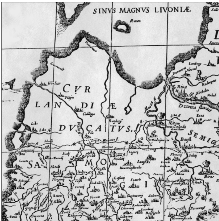
M. K. Radvilos Našlaitėlio 1613 m. išleisto LDK žemėlapių fragmentas. Jame Papilė (Popielany) pažymėta miestelių įvardijančių simboliu