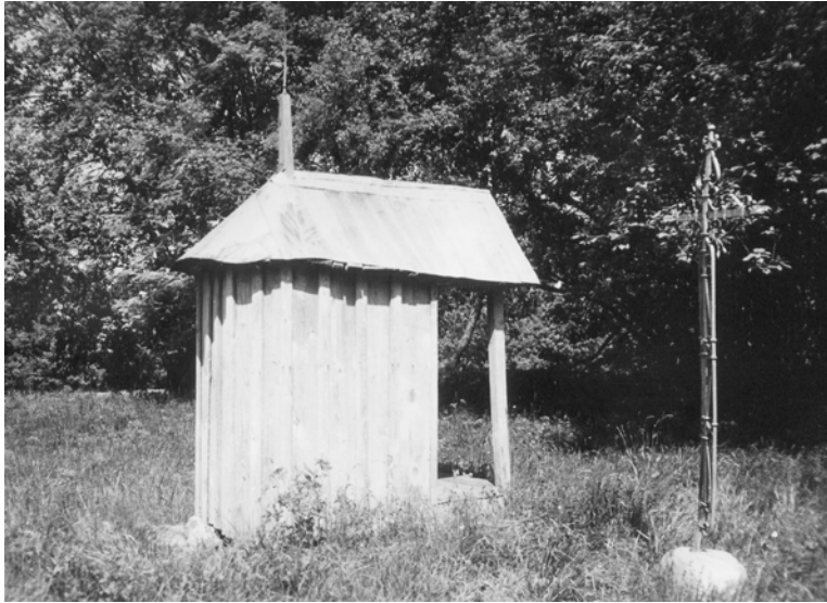
13 pav. Kopyltėlė su apside. Kretingos r., Kūlupėnų apyl., Prystovų k. KKM. 1987 m.