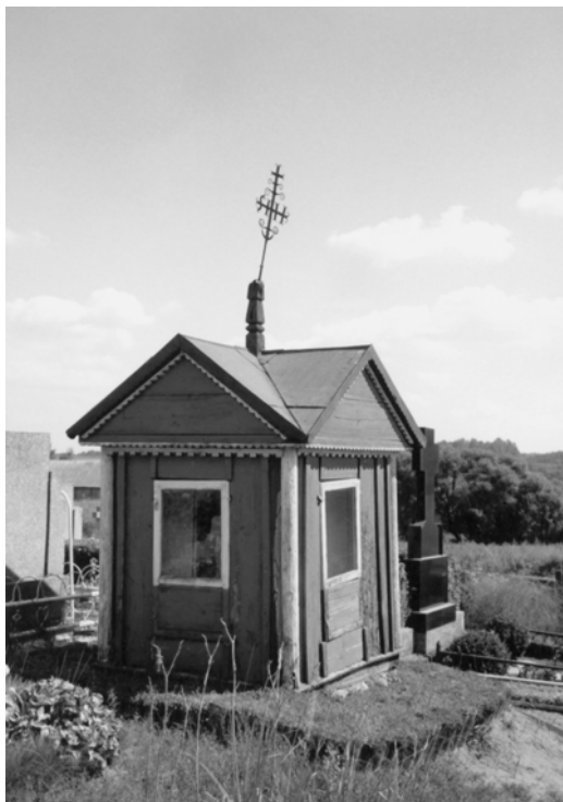
6 pav. Kartenos mstl. kapinių koplytėlė (XIX a. 9 dešimtmetis). Kretingos r. 2002 m.

Remiantis turimais pastatelių matmenimis galima teigti, kad senųjų Kartenos valsčiaus koplytelių vidutinis aukš-