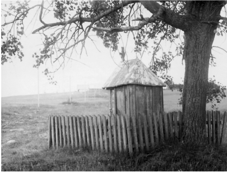
10 pav. Kopylytėlės trišlaičiu stogeliu nugarinis fasadas (XX a. 5 dešimtmetis). Kretingos r., Kartenos apyl., Sauserių k. KKM. 1984 m.