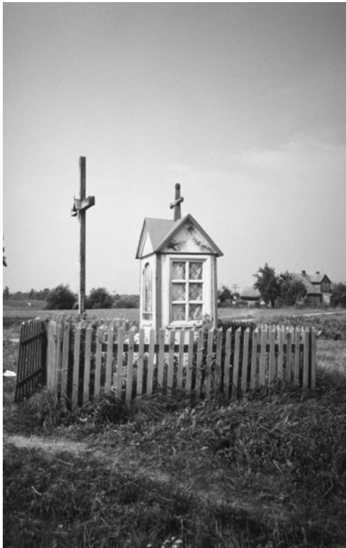
14 pav. Kopyltėlė „T“ raidės formos stogeliu. Kretingos r., Kūlupėnų apyl., Kūlupėnų k., sav. M. Venskienė. 2002 m.