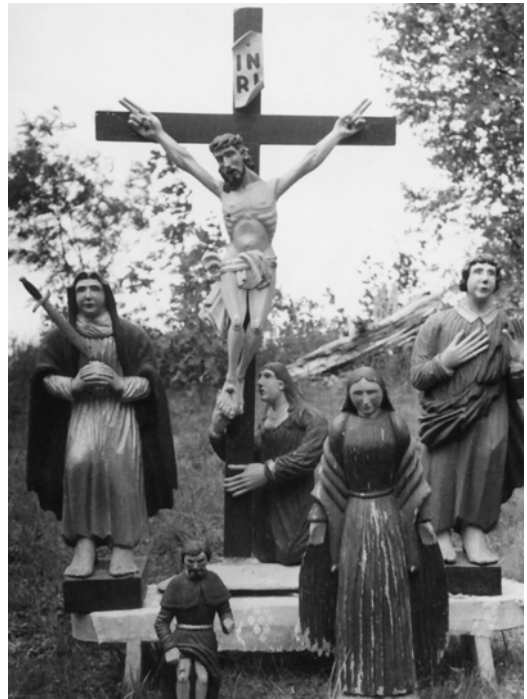
5 pav. Gaudučių senkapių koplytėlės skulptūros – Marija Sopulingoji, Nukryžiuotasis, šv. Marija Magdalena, šv. Morta, Marija Maloningoji ir šv. Rokas (XIX a. pab.). Kretingos r., Kartenos apyl. KKM, 1498.