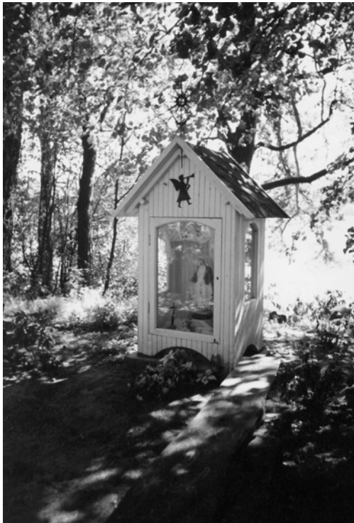
7 pav. Koplytėlė Budrių bažnyčios šventoriuje (XX a. pr.). Kretingos r., Žalgirio apyl. 2002 m.