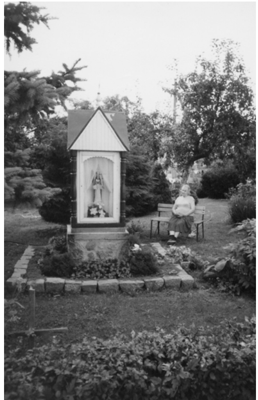
15 pav. Kopyltėlė kryžminių stogeliu (1999 m.). Kretingos mstl., sav. A. Viluckienė, autorius A. Rudelis. 2002 m.