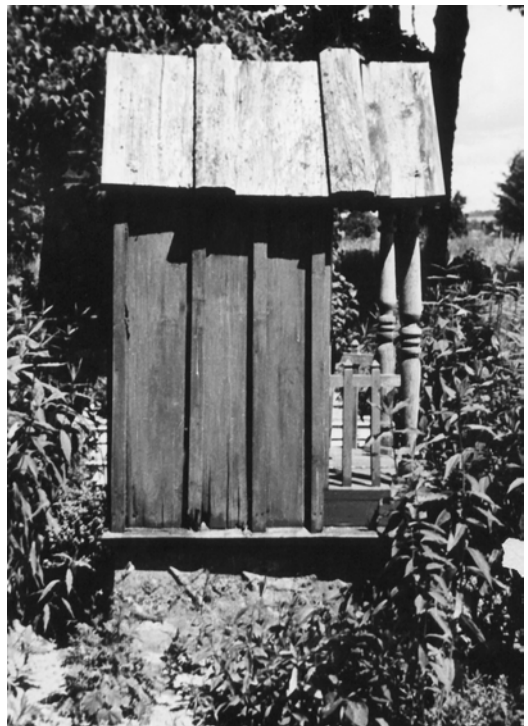
11 pav. Tvoarelės – būdingas Kartenos valsčiaus kopylytėlių elementas. Kretingos r., Kartenos mstl. kapinės.

Artimos minėtosioms yra stačiakampio plano kopylytėlės, kurių nugarinė sienelė būdavo užbaigta trisieniu. Tokiu būdu formuojama savotiška daugiakampiu stogeliu dengta apsidė, kurią dar labiau akcentuoja stogo kraigų sankirtoje pritvirtintas geležinis kryželis (Gaudučių, Prystovų senkapiai (13 pav.). Pagrindiniai šių kopylytėlių fasadai taip pat