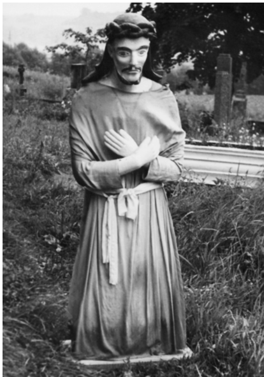
4 pav. Kristus Nazarietis. Kretingos r., Kartenos mstl. kapinės. KKM, GEK 9751. 1966 m.

Antra pagal įvairovę tema yra Kristaus vaizdavimas. Be įprasto stilizuoto kryželio, statomo paminklo viduje ar pritvirtinamo kur nors išorėje, koplytėlėse buvo statomos ir detaliau pavaizduotos