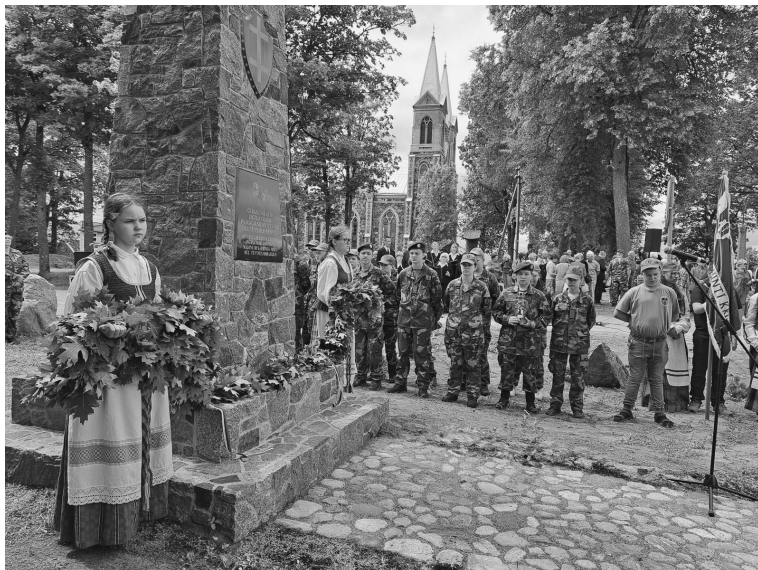
Prie paminklo partizanams stovi mergaitės tautiniais drabužiais su ažuolų vainiku. 2023 07 02