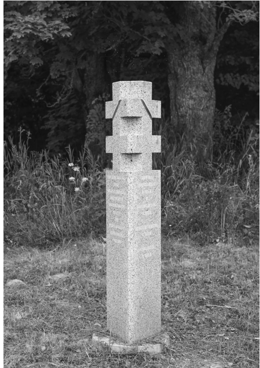
Įamžinta keturių partizanų žuvimo vieta Zablčiauje. 2023 m. liepos mėn.