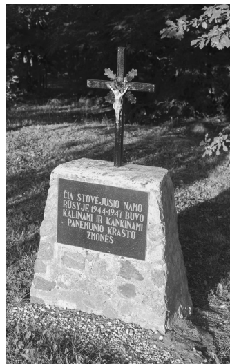
Paminklas Panemunio kankiniams atminti.

Ant jo užrašas: „Čia stovėjusio namo rūsyje 1944–1947 buvo kalinami ir kankinami Panemunio krašto žmonės“. 2023 m. liepos mėn.