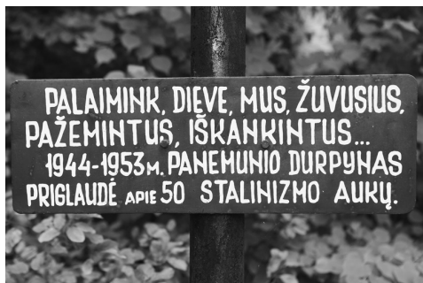
Kryžius prie partizanų užkasimo vietos Panemunio durpyne. 2023 m. liepos mėn.