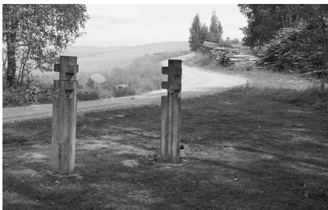
Paminklas Pažaselių kaime žuvusiems partizanams. 2023 m. liepos mėn. (nuotraukos viršuje)